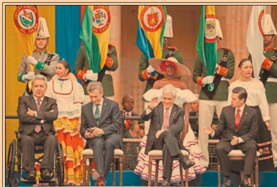
EPN y otros mandatarios, en la toma de posesión de Iván Duque; seguirá la colaboración. P46

HA SUBIDO la cotización del crudo Brent, lo cual impulsa a monedas emergentes.